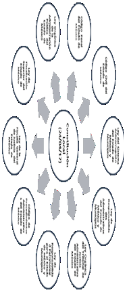
Elaboración propia con información obtenida de las publicaciones realizadas en la “Gaceta del Gobierno” del Estado de México, publicadas en el mes de mayo del año 2017.

Por ello, en mayo de 2017 fueron publicadas en la “Gaceta del Gobierno” del Estado de México, las expediciones de la Ley del Sistema Anticorrupción del Estado de México, la Ley de Responsabilidades Administrativas del Estado de México y Municipios y de la Ley Orgánica del Tribunal de Justicia Administrativa del Estado de México, así como, las reformas, adiciones y derogaciones a la